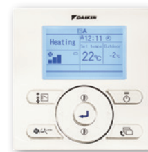
En option (BRC073)